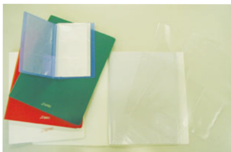
▲ファイルの用途例